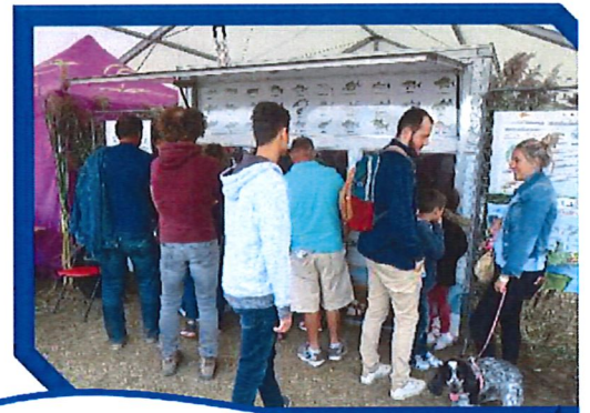
Succès de la remorque aquarium

Nous souhaitons vous faire partager ou revivre les moments forts de ce week-end.