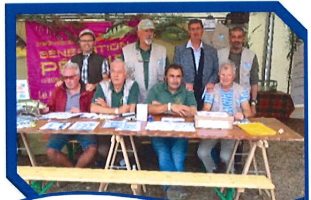
AAPPMA La Brème Sullyloise

L'édition 2019, qui avait pour invitée la région l'Auvergne, a connu un record de fréquentations, avec près de 27 000 visiteurs.