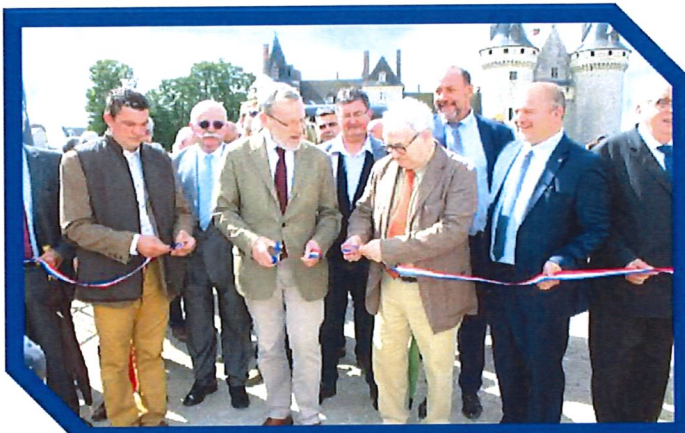
Inauguration par les officiels

L'édition 2019, qui avait pour invitée la région l'Auvergne, a connu un record de fréquentations, avec près de 27 000 visiteurs.