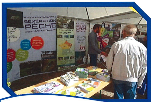
Association Régionale des Fédérations de Pêche

L'implantation et les animations proposées ont connu un beau succès, même s'il reste encore des progrès à faire.