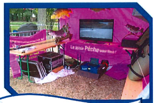
Le simulateur pêche