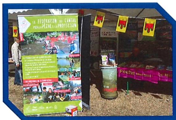
Les Fédérations de Pêche de l'Allier, Cantal, Puy-de-Dôme et Haute-Loire ont animé le village pêche