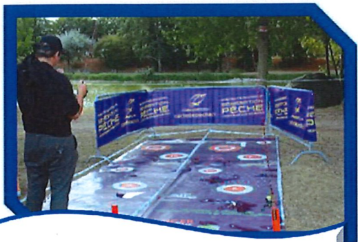
Les tapis de lancer