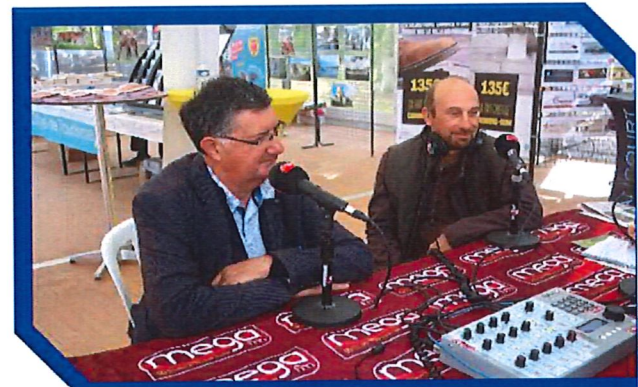
Le direct sur MEGA FM