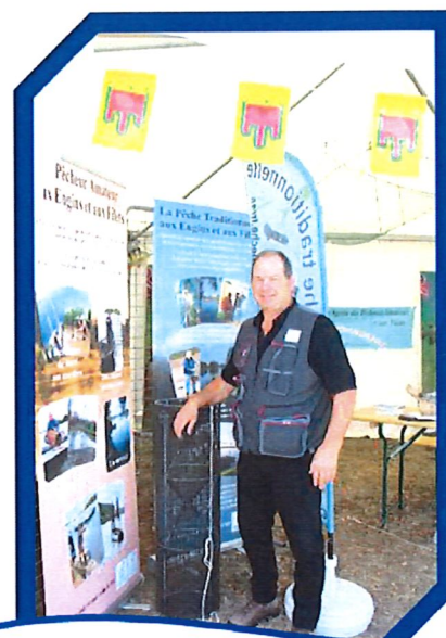
Les Pêcheurs Amateurs aux Engins et aux Filets

Aux vues de la fréquentation du village pêche, nous ne le démentirons pas