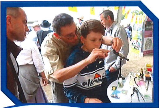
Initiation montage de mouches